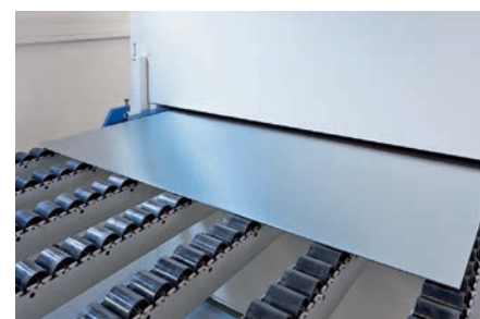
Lixagem a seco