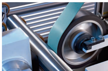
Rectificação sem centro de tubos