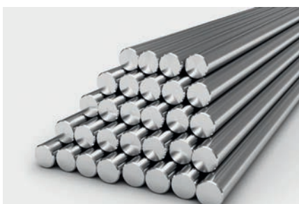
Lixagem de aço redondo e plano