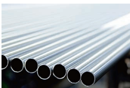
Lixagem de tubos redondos e rectangulares