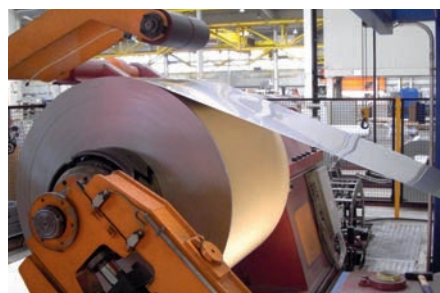
Processamento de bobines e chapa grossa