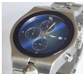
Relojoaria e joalheria