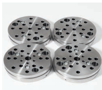
Fabricação de moldes